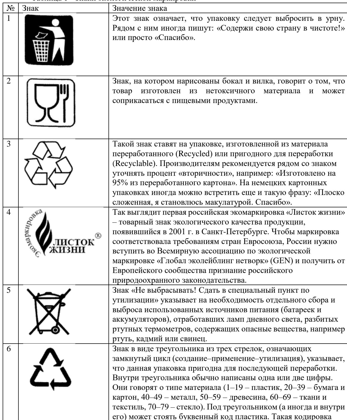
Таблица 1 - Знаки экологической маркировки

-разрабатывать и проводить санитарно-противоэпидемические профилактические мероприятия.