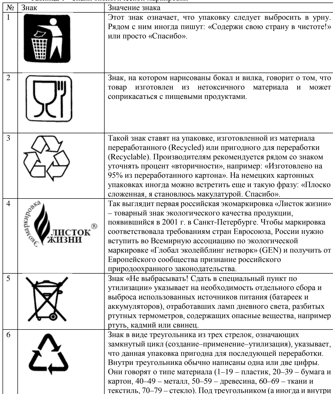
Таблица 1 - Знаки экологической маркировки

-разрабатывать и проводить санитарно-противоэпидемические профилактические мероприятия.