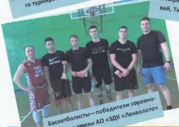
Баскетболисты — победители соревнований на призы АО «ЗДК «Лензолото»