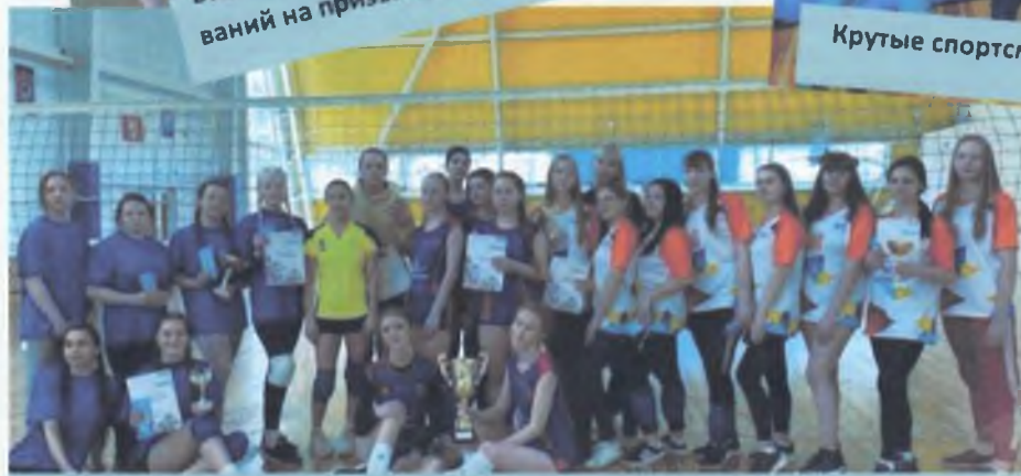
Женская команда БГТ по волейболу — победитель многих соревнований!

А ты внимательный читатель? Найди в тексте собаку вместо буквы «А» и получи ПРИЗ!!!